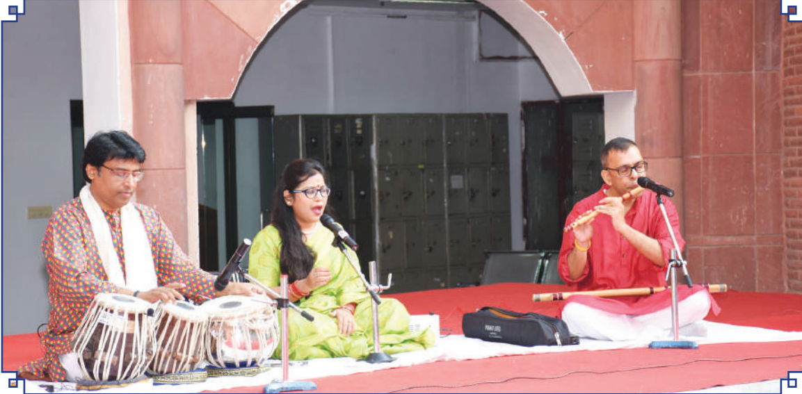
2 अक्टूबर, 2019 को महात्मा गाँधी जयंती के अवसर पर कलाकार महात्मा गाँधी जी के प्रिय भजन का प्रदर्शन करते हुए Artists perform Gandhi Ji's Priye Bhajan on the occasion of Mahatma Gandhi Jayanti on 2nd October, 2019.