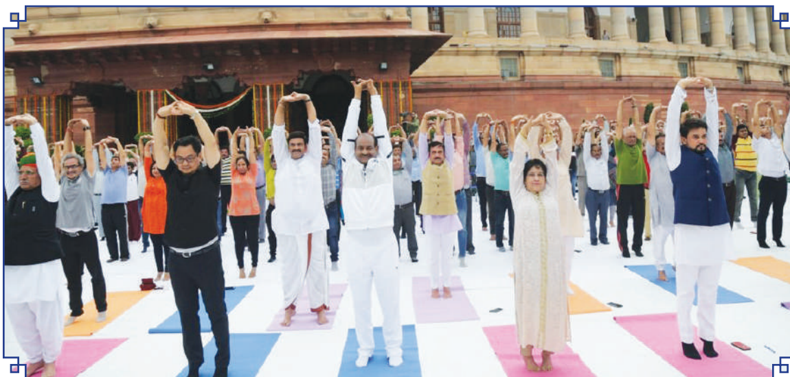
मो.दे.रा.यो.सं. ने 6 सितंबर 2019 को संसद भवन में फिट इंडिया मूवमेंट मनाने के लिए योग सत्र का आयोजन किया MDNIY organizes a Yoga session to celebrate Fit India Movement programme at Parliament on 6th September, 2019

Eminent dignitaries practicing Yoga during the celebration of 5th International Day of Yoga on 21 st June, 2019 at India Gate