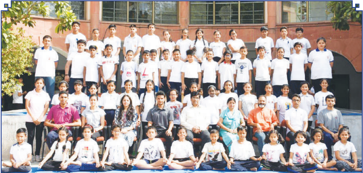
मई-जून, 2019 के दौरान ग्रीष्मकालीन योग कार्यशाला का एक दृश्य A view of Summer Yoga Workshop conducts during May-June, 2019