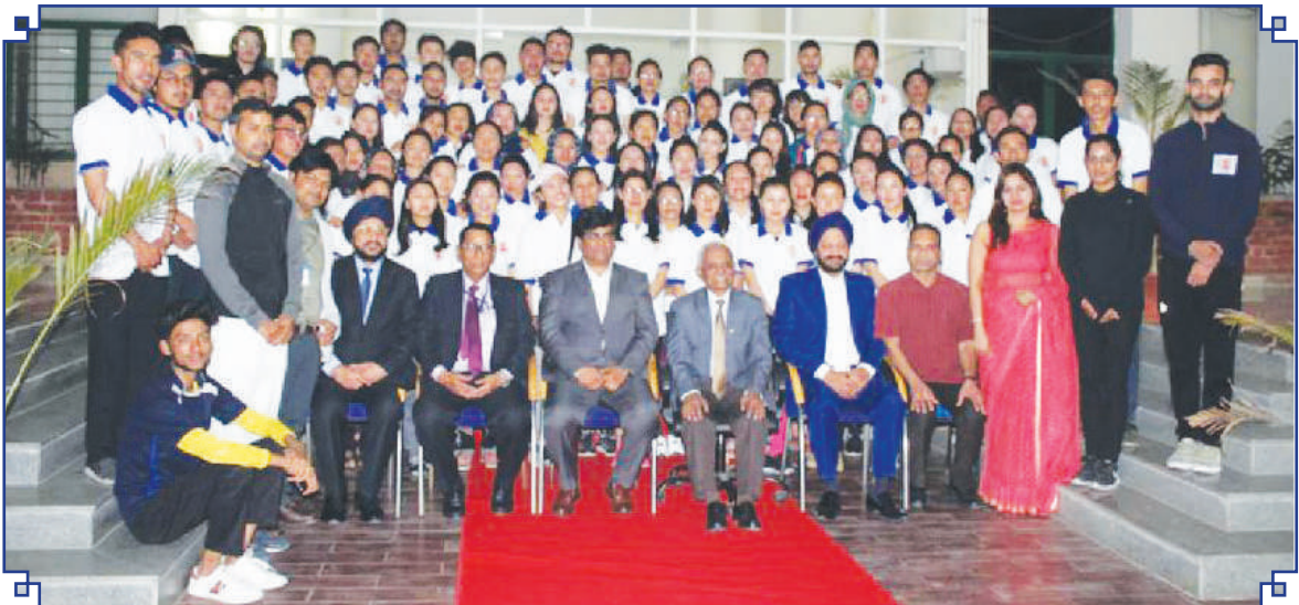
राष्ट्रीय सोवा रिग्पा अनुसंधान संस्थान, लेह के साथ सहयोग से मो.दे.रा.यो.सं. द्वारा संचालित एक माह की अवधि के प्रोटोकॉल अनुदेशक के लिए योग में सर्टिफिकेट पाठ्यक्रम के उद्घाटन समारोह के दौरान एमिटी विश्वविद्यालय में लेह के छात्र

Students of Leh at Amity University, Noida during the inaugural ceremony of Certificate Course in Yoga for Protocol Instructor of one month duration (200hrs) conducts by MDNIY in collaboration with National Research Institute of Sowa Rigpa, Leh