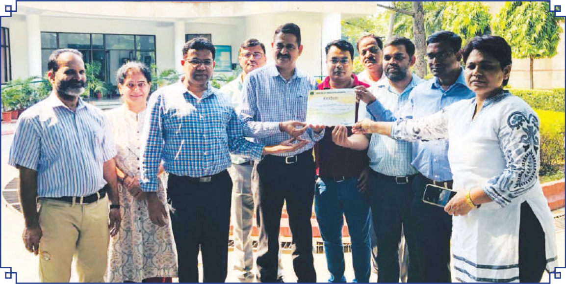
मोरारजी देसाई राष्ट्रीय योग संस्थान ने स्वच्छता रैंकिंग में प्रतिभागिता की और अप्रैल – जून, 2019 तिमाही में नई दिल्ली नगरपालिका परिषद (एनडीएमसी) में अवस्थित कार्यालयों में प्रथम स्थान पर रहा

Morarji Desai National Institute of Yoga participates at Swachhta ranking and stood FIRST position among Offices in New Delhi Municipal Council (NDMC) area for the Quarter April-June, 2019