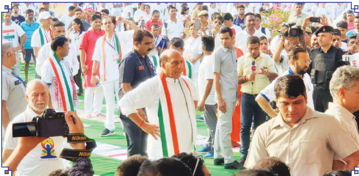
21 जून 2019 को इंडिया गेट पर 5वें अंतर्राष्ट्रीय योग दिवस उत्सव के दौरान योग का अभ्यास करते हुए विशिष्ट गणमान्य व्यक्ति

Eminent dignitaries practicing Yoga during the celebration of 5th International Day of Yoga on 21 st June, 2019 at India Gate