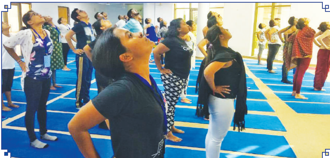
57वें भारत को जानें कार्यक्रम (केआईपी) के 40 प्रवासी भारतीय युवाओं का एक दल 7 नवंबर 2019 को संस्थान में

A view of Y-Break, 5 minutes Yoga protocol at the Ministry of AYUSH, AYUSH Bhavan