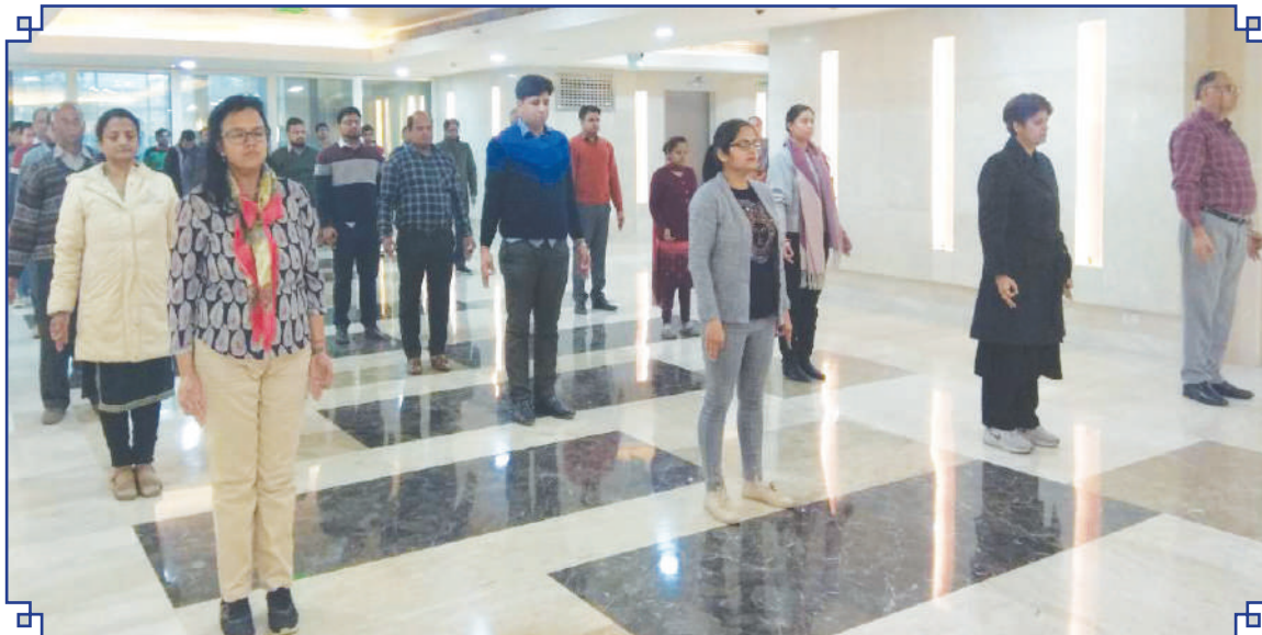
आयुष मंत्रालय, आयुष भवन में वाय – ब्रेक, 5 मिनट का योग प्रोटोकॉल का एक दृश्य

A view of Y-Break, 5 minutes Yoga protocol at the Ministry of AYUSH, AYUSH Bhavan