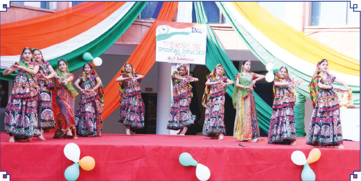
संस्थान में दिवाली उत्सव का एक दृश्य

Morarji Desai National Institute of Yoga participates at Swachhta ranking and stood FIRST position among Offices in New Delhi Municipal Council (NDMC) area for the Quarter April-June, 2019